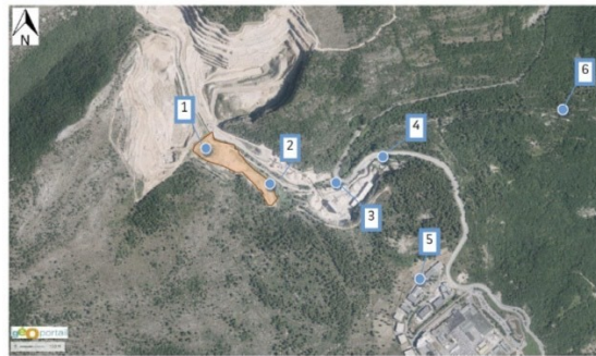
Point 3 : bureaux de la SEC / Point 4 : entreprise du RTP / Point 5 : parc d'activités de la Santé / Point 6 : habitation la plus proche

L'information relative aux retombées atmosphériques est issue de la surveillance de la carrière SEC. La pollution atmosphérique est objectivée par des analyses de poussières 7 PM10 et PM2.5 réalisées le 8 septembre 2021. L'El précise que « ces résultats ne sont pas représentatifs d'une moyenne annuelle » aussi la comparaison de la valeur observée au point 5 avec la valeur limite pour la protection de la santé humaine n'est pas cohérente. En effet, les résultats ne sont représentatifs que de la qualité de l'air le jour de la mesure. La méthodologie utilisée ne permet pas de caractériser avec justesse l'état initial.